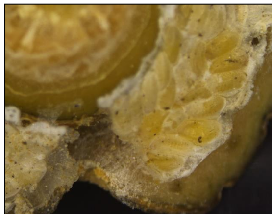
Figures 1 et 2 : œufs sous le pédoncule d'un pomelo (AREFLEC, 2016)

Ensuite, les larves vont dans le sol et s'alimentent des racines pendant les 6 à 10 mois suivants. La larve peut s'enfoncer à une profondeur de 61 cm (Woodruff & Bullock, 1979). Pour faire sa puppe, la larve remonte à la surface du sol (fig.3). En fonction des régions, il peut y avoir deux générations par an mais en général une seule est produite chaque année (King, 1958). Les adultes peuvent vivre entre 3 et 8 mois (Masaki et al. , 1996).