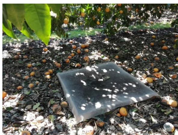
Figures 5 : cadrat de captures des charançons adultes émergents du sol (AREFLEC, 2018)