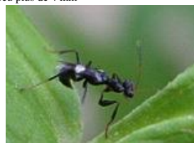
Adulte femelle de Neodryinus typhlocibae