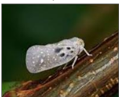
Les metcalfa pruinosa .

La seule solution durable est de parvenir à l'implantation de son ennemi naturel.