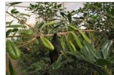
Taille des unités de lâchers environ 15 cm