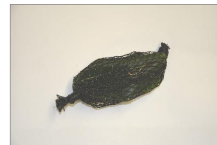
Taille des unités de lâchers environ 15 cm

Le produit proposé comprend des unités de lâchers composées de 5 femelles et 10 mâles. Ces unités sont fournies sous la forme de filets contenant des feuilles sous lesquelles se sont fixés les cocons.