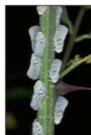
Chapelet de Metcalfa adultes

Les adultes mesurent entre 7 et 9 mm, les larves mesurent entre 2 et 6mm