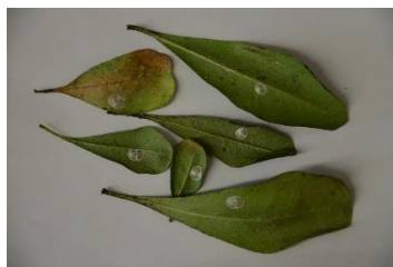
Cocons de Neodryinus typhlocibae Taille du cocon femelle : un peu plus de 4 mm

Son développement a été variable en fonction des zones de lâcher car il dépend des conditions environnementales et de la pression phytosanitaire. De plus, elle a été limitée par la disponibilité en insectes qui n'étaient pas encore produit en conditions contrôlées.