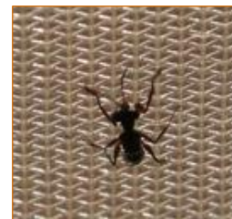
Adulte femelle de Neodryinus typhlocibae